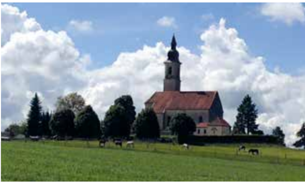
Blick auf Alxing.

Durch Baumhau hindurch geht es wieder bergab, bis wir am Ende der Straße wieder auf die Grafinger Straße treffen. Wir folgen ihr zunächst rechts (Wegweisung „Bruck/Bruckmühl/Sempt-Mangfall-Radweg) und biegen bald wieder links ab, hinauf in Richtung Pullenhofen.